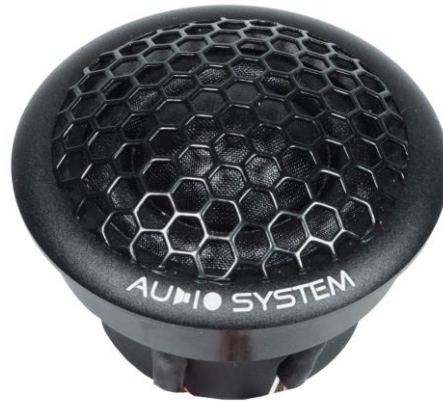
HS25 DUST EVO