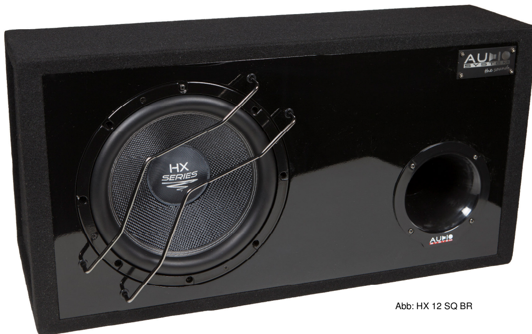
Abb: HX 12 SQ BR