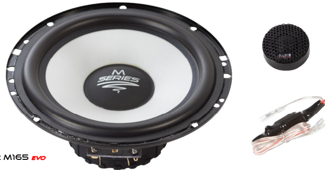
Abb.: M165 EVO