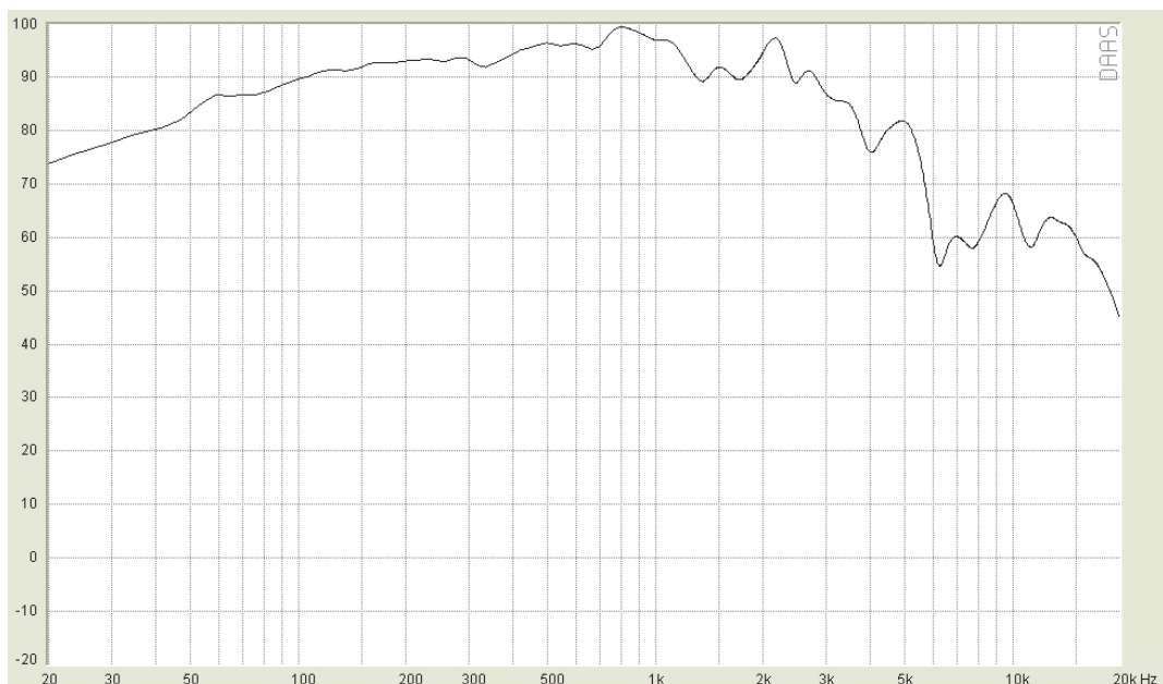
FREQUENZGANG AUF ACHSE / FREQUENCY RESPONSE ON AXIS