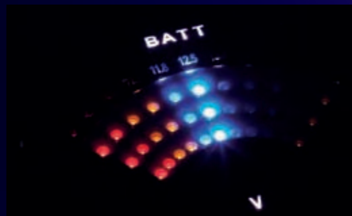
Old School: Die Power-Meter-Anzeige weckt Erinnerungen an gute alte HiFi-Tage. Hier können Batterie-Spannung und Ausgangsleistung abgelesen werden.

Die Ausstattung der T 2500-1 bd steht einem Subwoofer-Verstärker gut zu Gesicht. Der obligatorische Tiefpassfilter trennt mit 24 dB pro Oktave (Butterworth-Charakteristik) und übernimmt zusammen mit dem zuschaltbaren Subsonic-Filter (12 dB Flankensteilheit, -3-dB-Punkt bei 28 Hz) die Beschneidung des Signals. Ein Bass-Boost hebt