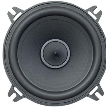
EX 100 PHASE EVO3